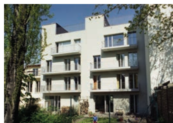
„Wohnhäuser Mahlerstraße“ in Berlin-Weißensee von dmsw Architekten, Berlin

Und zum Aspekt des Kanalisierens: Wenn die Kommune einen Kanal in sozial schwierige Gebiete legen will, dann wird der Preis dafür höher sein, weil da auch mehr geleistet wird. Ausschließlich auf den guten Willen zu setzen, finde ich unse- riös. Kurz gesagt: Die Kommunen brauchen in Zeiten, in denen sie angeblich Vermögenswerte versilbern müssen, für viele Aufgaben kein Geld mehr haben und zunehmend auf aktive Bewohner angewiesen sind, schlicht mehr Phantasie. Oder zu- mindest die Bereitschaft, sich auf phantasievollere Lösungen einzulassen.