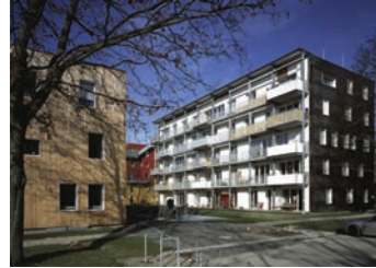
„Kleehäuser“ in Freiburg-Vauban von Gies Architekten, Freiburg