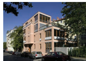
„Gartenhaus Methfessel- straße 9“ in Berlin-Kreuzberg von Siegl und Albert, Berlin