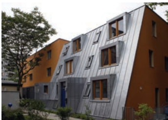
„Haus und Hof“ in Berlin- Kreuzberg von Siegl und Al- bert, Berlin