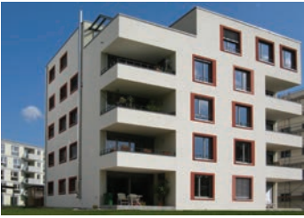
„Baugemeinschaft Pluspunkte“ in Freiburg-Vauban von Amann Burdinski Architekten, Freiburg