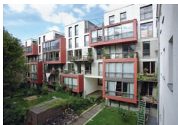
„Wohnetagen Steinstraße“ in Berlin-Mitte von Carpaneto Schönigh, Berlin

Das ist für mich der entscheidende Ansatz, um der grundsätzlich guten Idee einen neuen Impuls zu geben. Es ist allerdings so, dass andere Organisations- oder Rechtsformen nur relativ wenig bringen. Viele vergessen, dass die Kosten für das Wohnen immer von den Bewohnern zu tragen sind. Ob Miete oder Zins, das ist rein finanziell betrachtet ohne Bedeutung. Ein Grundstück etwa im Erbbaurecht als Voraussetzung zu haben, würde aber zumindest den potentiellen Teilnehmerkreis er-