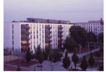
„Wohnen an der Marie“ in Berlin-Prenzlauer Berg von Arnold Gladisch, Berlin