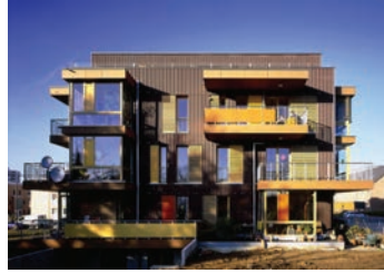
„Familienwohnen Alkmenestraße 24“ in Frankfurt-Preungesheim von bb22, Frankfurt am Main