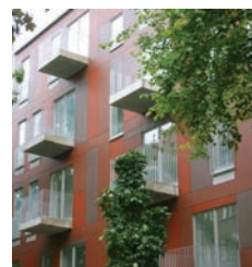
„Kreutziger Straße 20“ in Ber- lin-Friedrichshain von Roedig Schop, Berlin